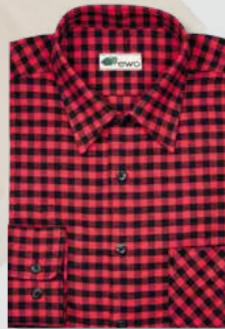
128 red / black