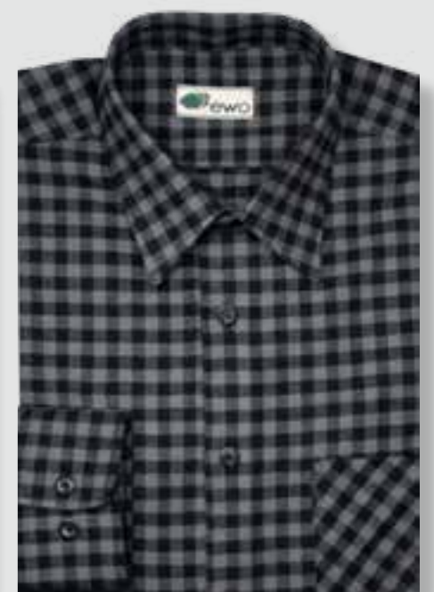
801 grau / schwarz