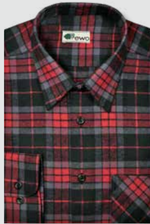
840 grau / rot