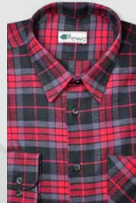
840 grau / rot