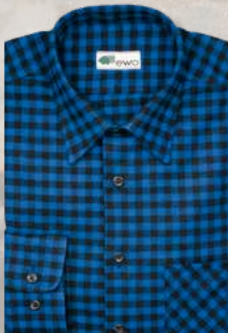
248 marine / schwarz