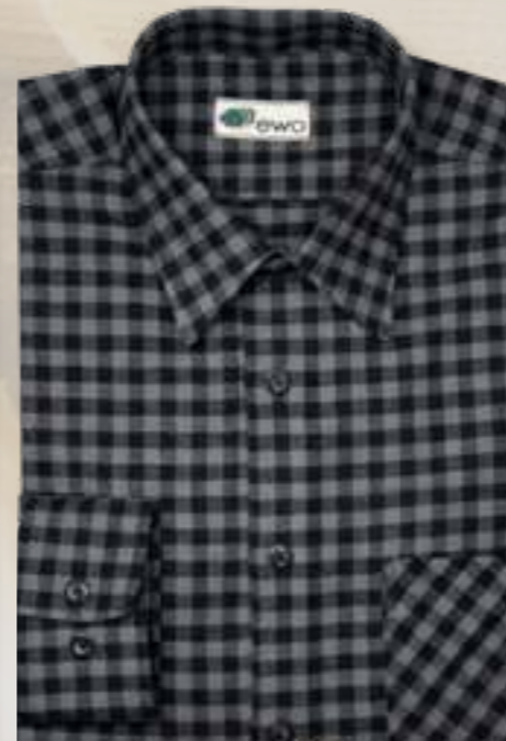
801 grau / schwarz