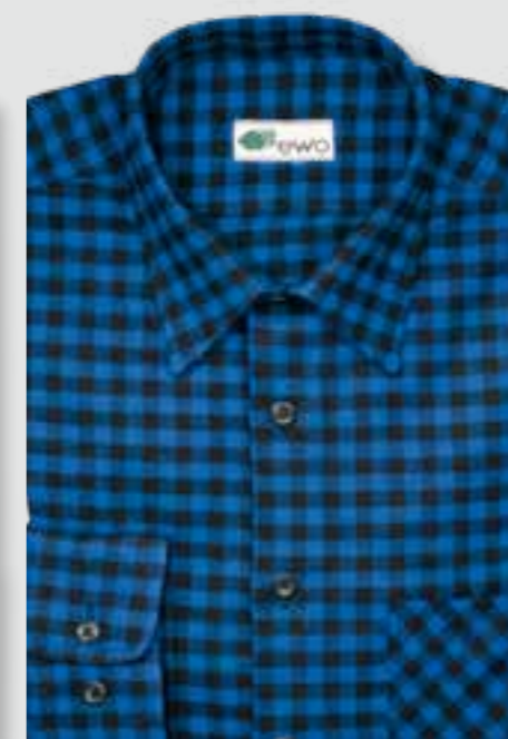
248 marine / schwarz