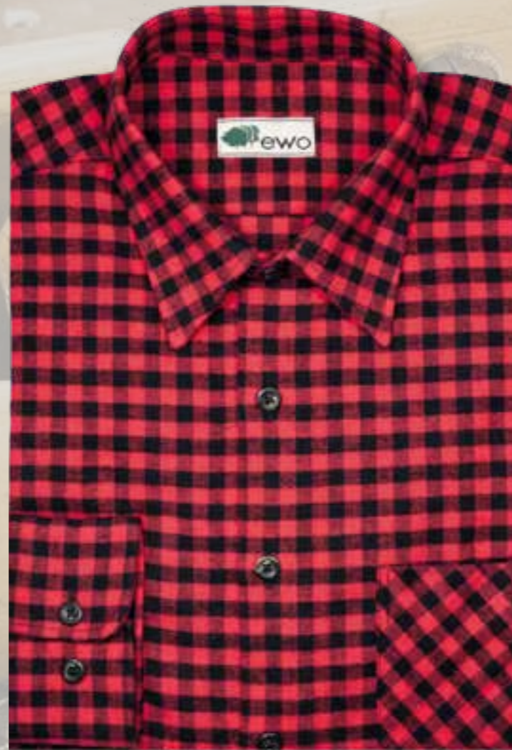
128 red / black