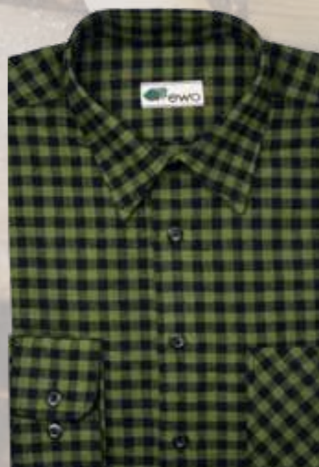
302 green / black