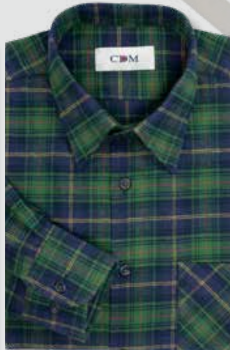
325 grün / marine