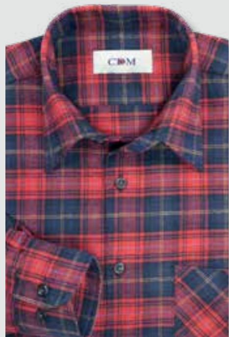
106 rot / marine

Premium Flanell 100 cm lang EXTRA LANGER ARM 69 CM