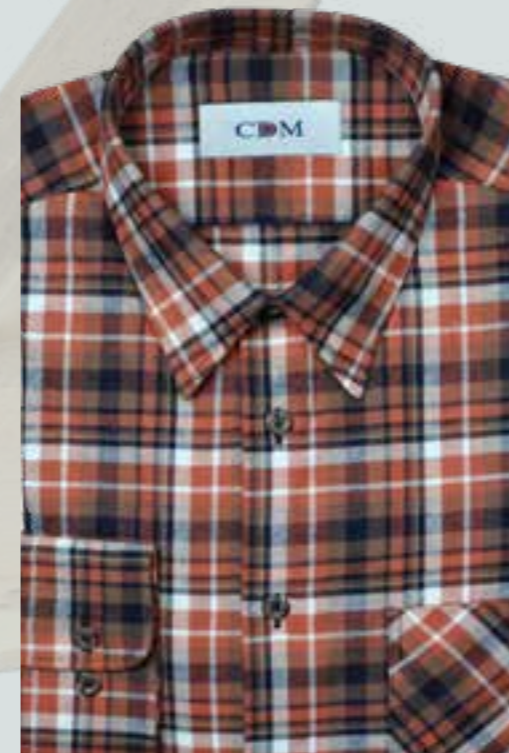
125 orange / marine