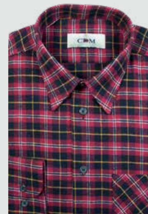
292 marine / rot