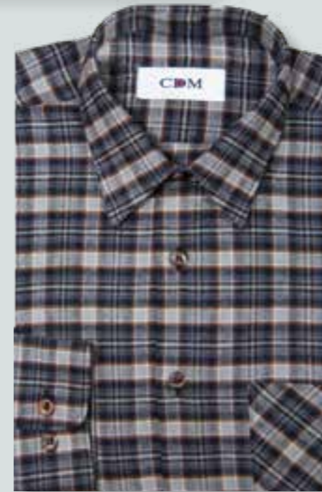
803 grau / blau