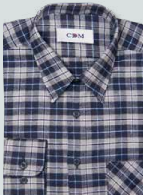
226 marine / grau