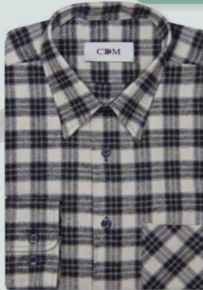
801 grau / schwarz