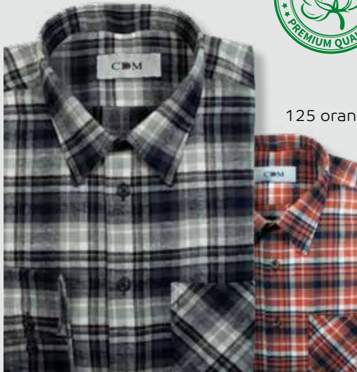
125 orange / marine