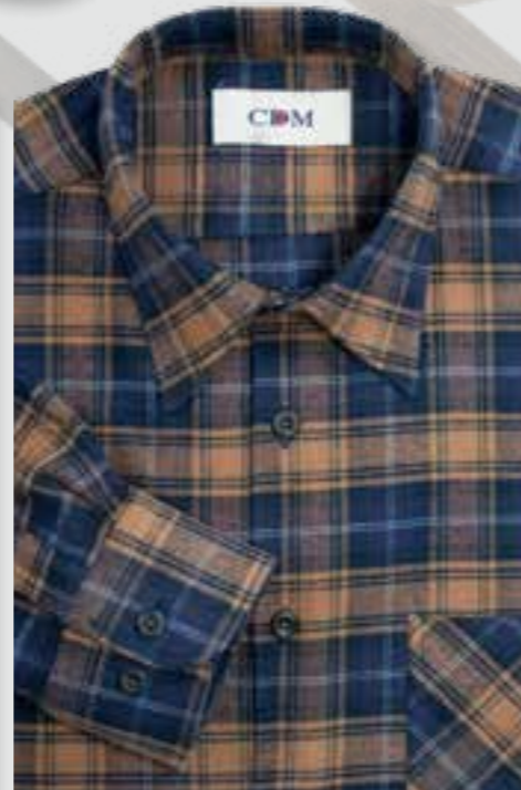
902 braun / marine