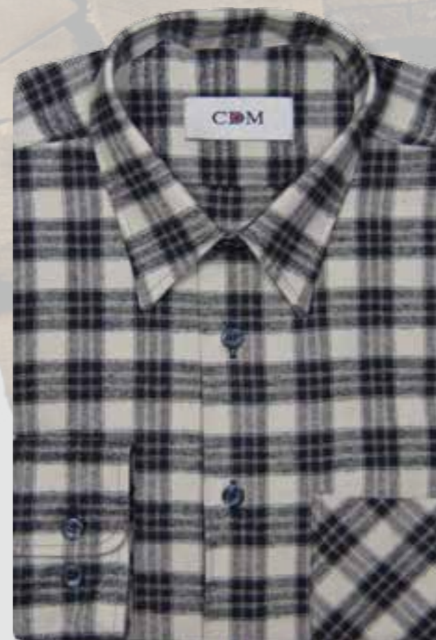
801 grau / schwarz