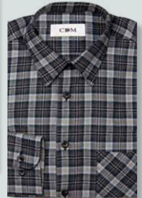
845 grau / braun