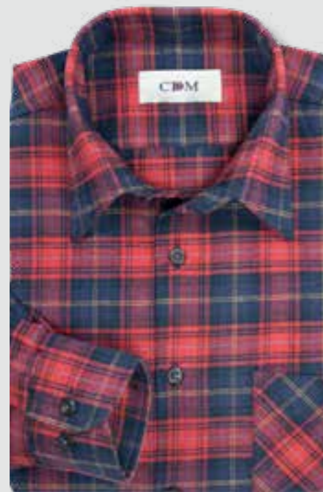
106 rot / marine