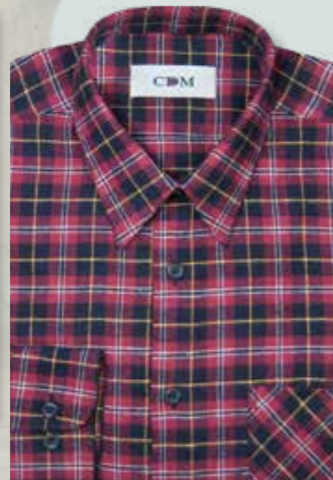
292 marine / rot