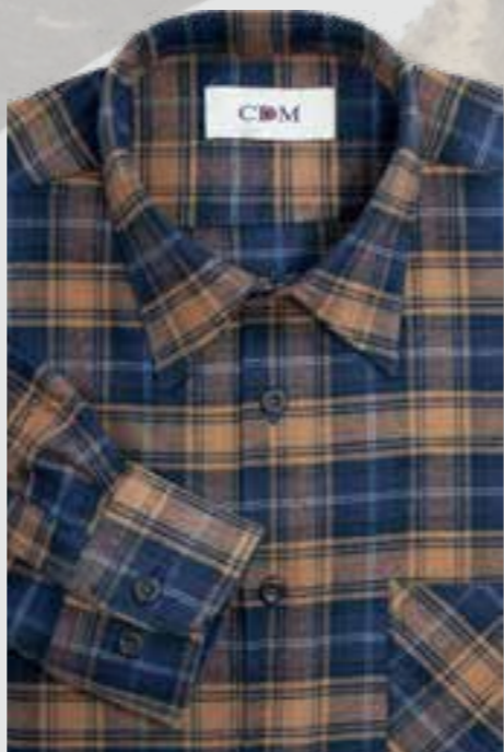
902 braun / marine