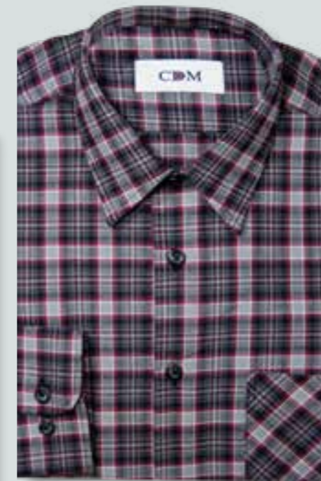
840 grau / rot