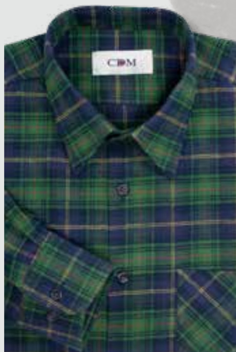
325 grün / marine