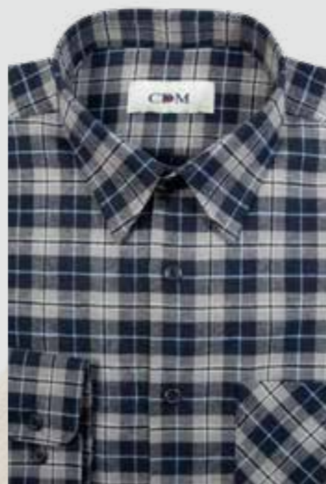
226 marine / grau