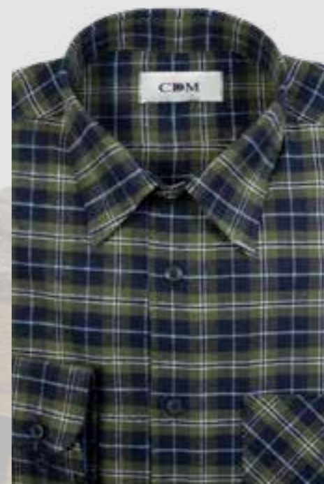
281 marine / oliv