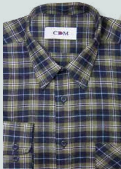
281 marine / oliv