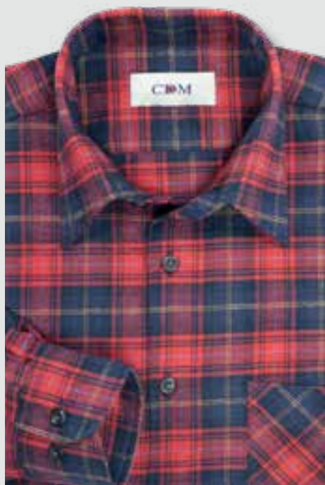
106 rot / marine